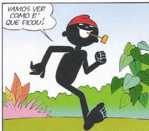
Figura 4. Pererê