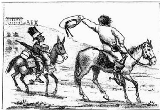
Figura 5. Benedito e seu patrão Nhô Quim