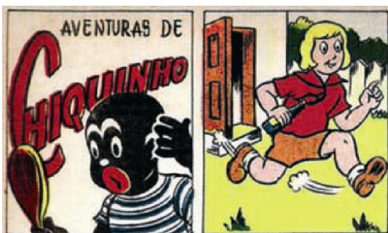
Figura 7. Benjamim e Chiquinho