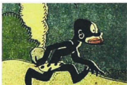
Figura 9. Lamparina