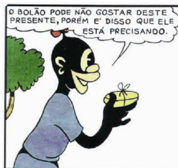
Figura 8. Azeitona