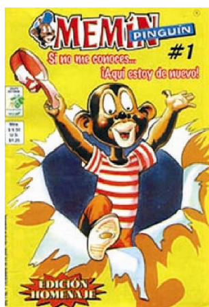
Figura 3. Memín Pinguín