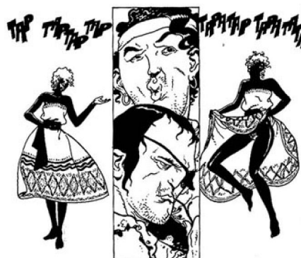
Figura 2. Fulú