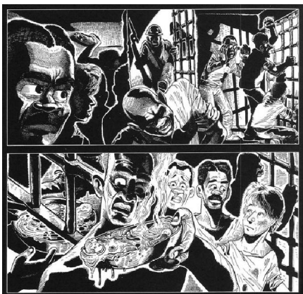
Figura 13. Chibata