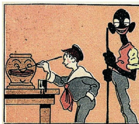
Figura 6. Juquinha e Giby