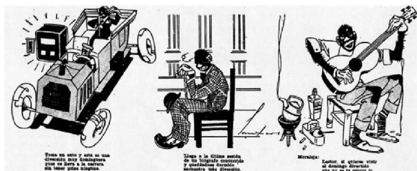
Figura 1. El negro Raúl