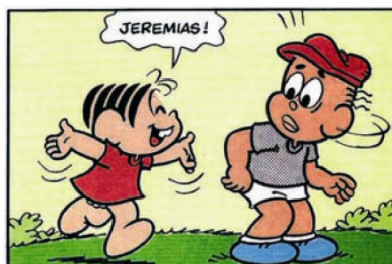
Figura 10. Mônica e Jeremias