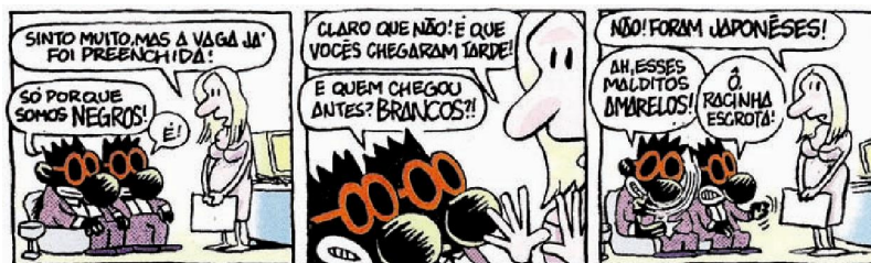
Figura 12. The Little Black Skrots