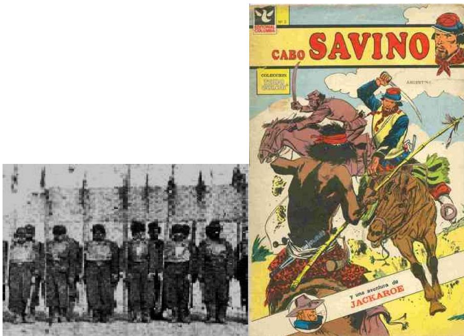
Pozzo 1879 (Museo Roca); Casalla s/f