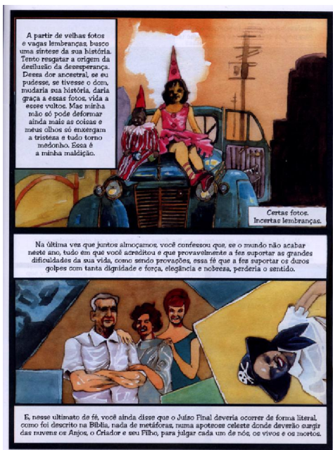
FIGURA 2: Página da história Dor Ancestral (Mutarelli, 2004, p.53)