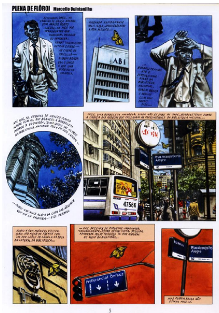
FIGURA 4: Página da história Plena de Flôroi (Quintanilha, 2009, p.5)