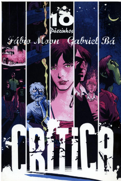
FIGURA 5: Capa de Crítica (Moon e Bá, 2004).