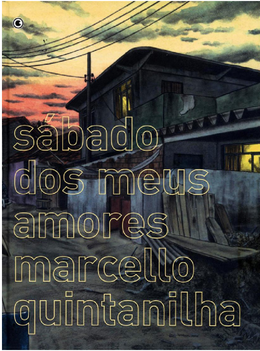
FIGURA 3: Capa de Sábado dos meus amores (Quintanilha, 2009).