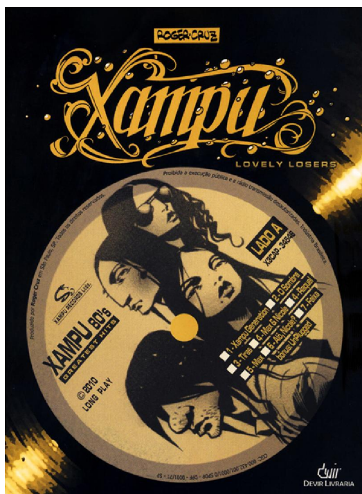
FIGURA 6: Capa de Xampu: lovely losers (Cruz, 2010)