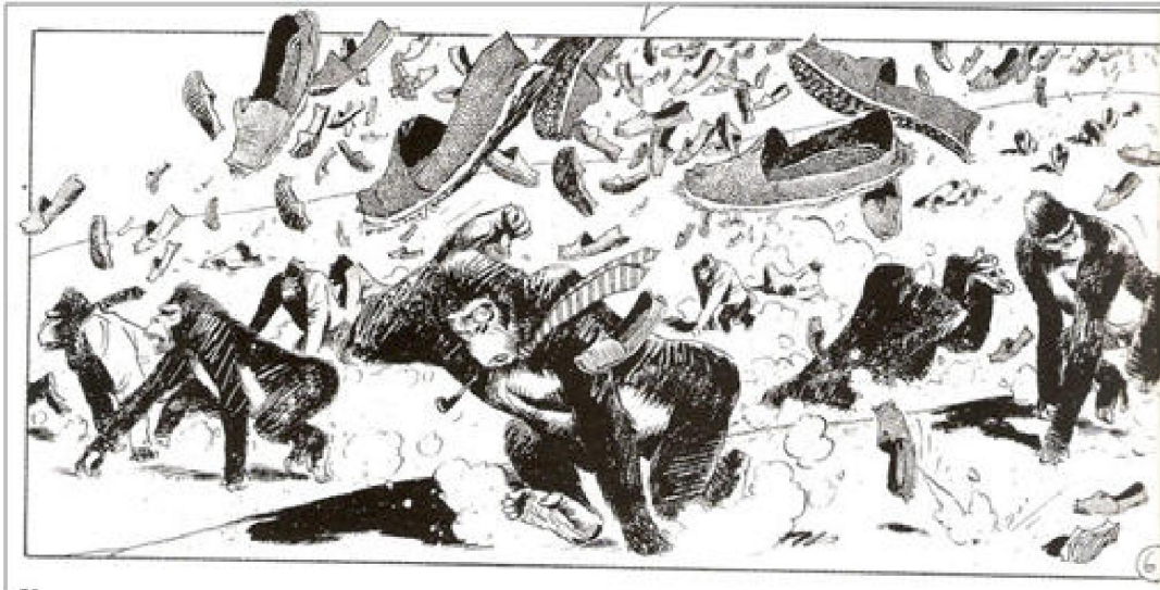
Figura 2: Gorilas y alpargatas: la batalla por la identidad nacional