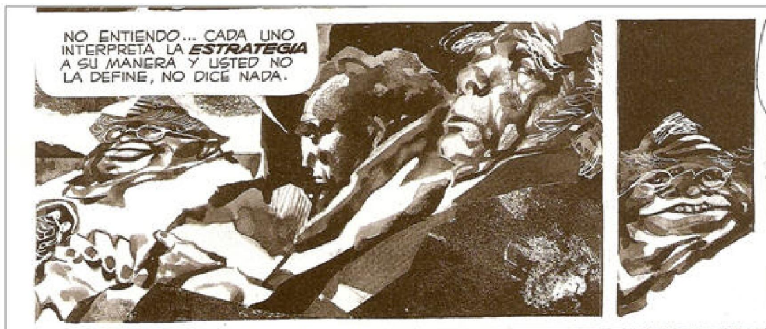
Figura 6: La estrategia de la tortuga. Una mirada sobre el accionar político de Perón desde el exilio