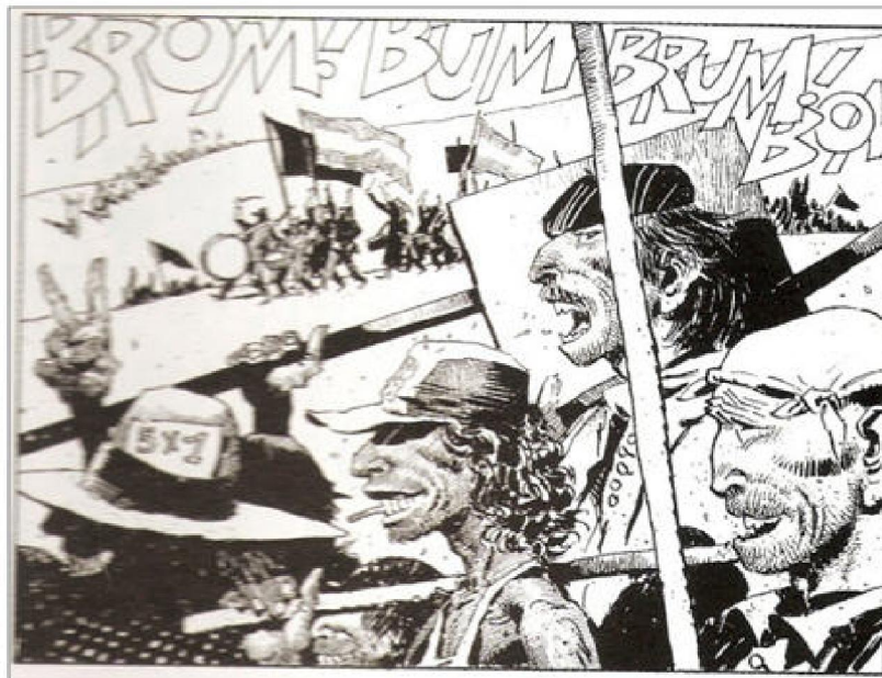
Figura 3: Las fuerzas del General. Breccia recupera el clima de las manifestaciones peronistas