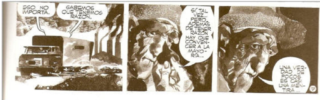
Figura 5: Verdades. Una crítica a la militancia revolucionaria de los '70