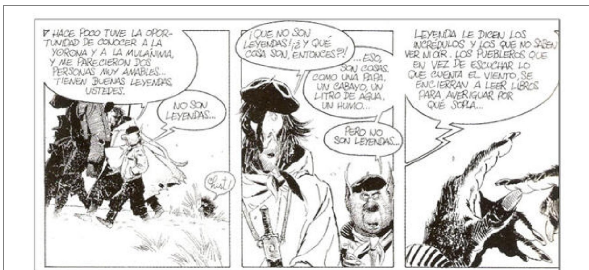
Figura 1: Mitos. El Lobizón resalta su importancia