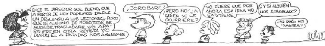
Imagen 1: Primer tira humorística de «Mafalda» que sale en el Semanario Primera Plana, ubicado en la página 22 de la revista, el día 29 de septiembre de 1964.

Imagen 2: Primer tira humorística de «Mafalda» que sale en el Semanario Primera Plana, ubicado en la página 64 de la revista, el día 29 de septiembre de 1964.